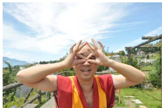
想一想，智慧之眼要如何開？