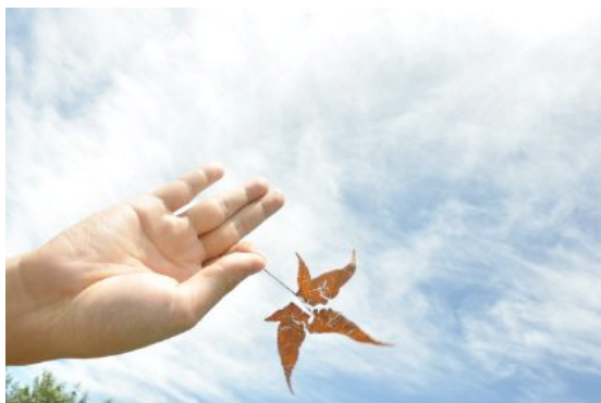
捻花微笑與手捻楓葉，有何不同？

同時，還要放寬心量，宏觀未來。心量小，則是「異」；心量大，則是「一」。如何把握當下，善用這一生，發揮生命中最大的良能，自利利他，在心大量大中行菩薩行，這樣才能得道，才有契入大乘道的一天。